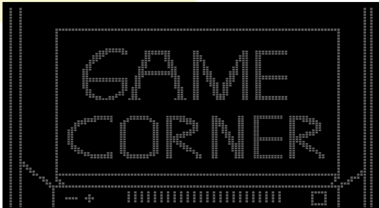
Illustration: Karl Krigsman